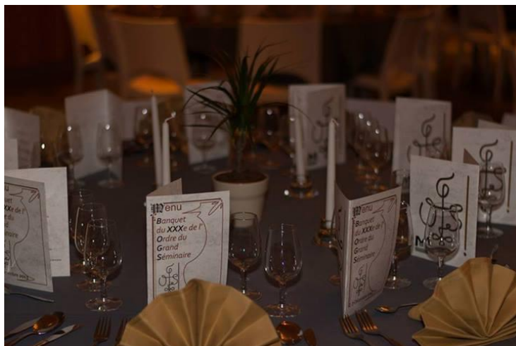
Ordre Souverain de la Calotte

C'en fut fini vers 15h30 des festivités au sein du Coeur épiscopal de la cité des Princes-Évêques. Le cortège s'en fut donc – d'une manière plus ou moins sûre selon les guides – dans le décor tranchant par sa modernité du Cadran pour un apéro. C'est dans ce décor agréable et tendance que les quelque 90 participants à ce sixième lustre purent ainsi déguster au coin du bar quelques verrines accompagnés de pils aidant à la descente, avant de rejoindre vers 17h la salle de